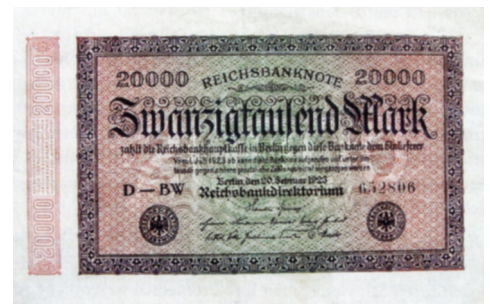
20.000 Mark-Reichsbanknote 1923