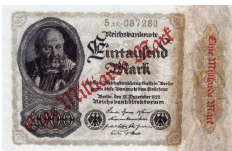
1 Milliarde Mark-Reichsbanknote 1923

Nur eine Währungsreform konnte Abhilfe schaffen. Diese wurde mit der Einführung der Rentenmark als neue auf Goldbasis beruhende Währung erreicht. So entsprach eine Rentenmark einer Billion Papiermark.