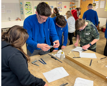
Die SchülerInnen bei der Arbeit an ihrem Werkstück „der Rosenkavalier“

Dieses Projekt fördert die langfristige Zusammenarbeit von Mittelschulen und Unternehmen der Metall- und Elektroindustrie. Ziel ist es, die Schüler auf die Metall- und Elektroindustrie aufmerksam