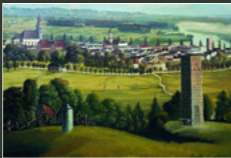
Stadtansicht, um 1860, Nikolaus Gumberger