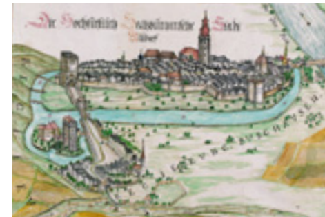
Stadtansicht von Mühldorf, um 1765

Der untere romanische Teil des Turms ist aus roh bearbeiteten Findlingen gemauert, während die anderen Obergeschosse spätmittelalterlich sind, eine Tuffquaderverblendung haben und nach außen hin den Backstein zeigen. Im Jahre 1809 wurde eine Wohnung für den Türmer eingebaut. Zuvor hatte der Stadttürmer seinen Dienst im Altöttinger Tor versehen. Von dort musste er in den Nagelschmiedturm umziehen, da das Altöttinger Tor zum Teil abgebrochen und verbreitert wurde.