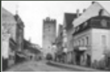
Blick auf den Nagelschmiedturm, um 1910