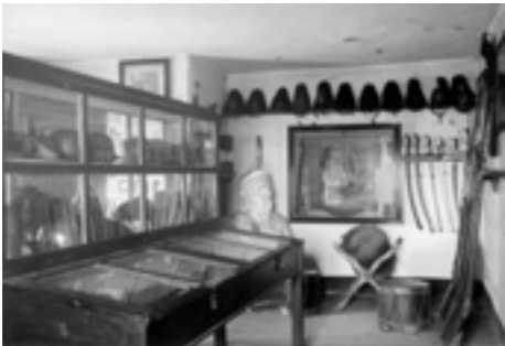
Stadtmuseum im Nagelschmiedturm, 1935

1877 plante das Bezirksamt Mühldorf den Nagelschmiedturm im Rahmen des neu erstellten Baulinienplans von 1872 abzubauen. Der Stadtmagistrat fasste jedoch den Beschluss den Turm auf Grund seiner historischen Bedeutung nicht abzubauen, sondern zu erhalten. Als 1908 die Wohnräume des Türmers frei wurden, begann man im leeren Turm das städtische Museum einzurichten. Da das Gebäude im Laufe der Jahre immer weniger den Anforderungen eines modernen Museums entsprach, stellte man 1974 im neu errichteten Kreismuseum die Objekte neu auf.