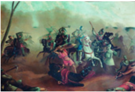
Fresko mit der Gefangennahme Friedrichs des Schönen 1838/1839

1838 ließ der Verschönerungsverein von Mühldorf im inneren Durchgangsbereich des Turms ein Fresko von dem Berchtesgadener Maler Harras anfertigen, das die Gefangennahme Friedrichs des Schönen in der Schlacht bei Mühldorf 1322 zeigte. Die ungünstigen Witterungsverhältnisse im Inneren des Nagelschmiedturms waren dafür verantwortlich, dass das Fresko im Laufe der Jahrzehnte immer mehr zerstört wurde, so dass man es schließlich gegen Ende des 19. Jh. übertünchte.