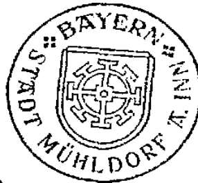
Günther Knoblauch 1. Bürgermeister