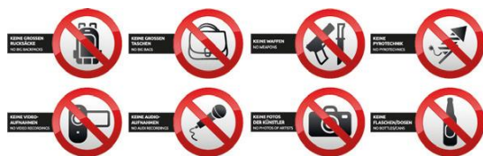
Foto-, Film- und Videoaufnahmen sind bei den Konzerten grundsätzlich verboten. Die Besucher werden deshalb gebeten, auf das Veranstaltungsgelände keine professionellen Kameras mitzubringen.

Der Bayerische Rundfunk und die Kreisstadt Mühldorf a. Inn bitten um das Verständnis aller Besucherinnen und Besucher.