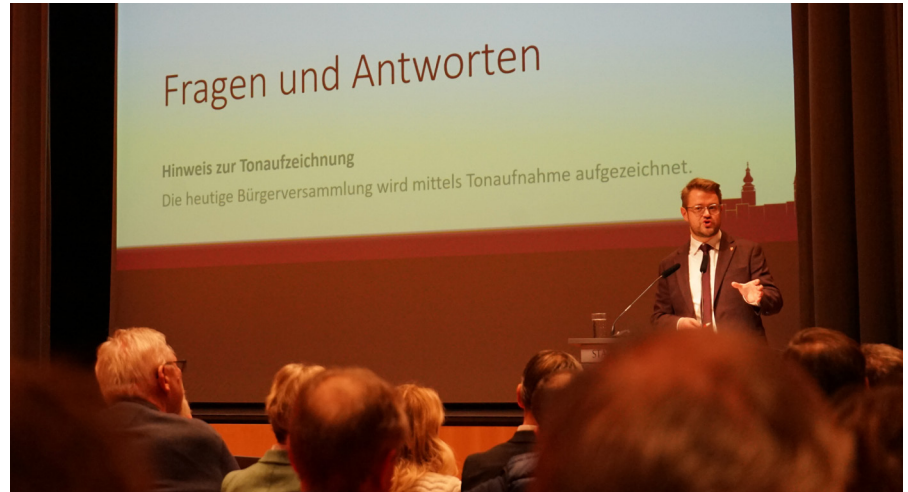
Bürgermeister Michael Hetzl stellt sich bei einer der beiden Bürgerversammlungen im Januar 2026 den Fragen der Menschen in Mühldorf.

Hetzl: Absolut. Finanziell steht die Kreisstadt Mühldorf a. Inn weiterhin erstklassig da, so dass ohne Neuverschuldung mehr als die unbedingt nötigen Investitionen gestemmt werden können. Von dieser Ausgangslage träumt man andernorts. Wir haben übrigens in den vergangenen sechs Jahren schon 75